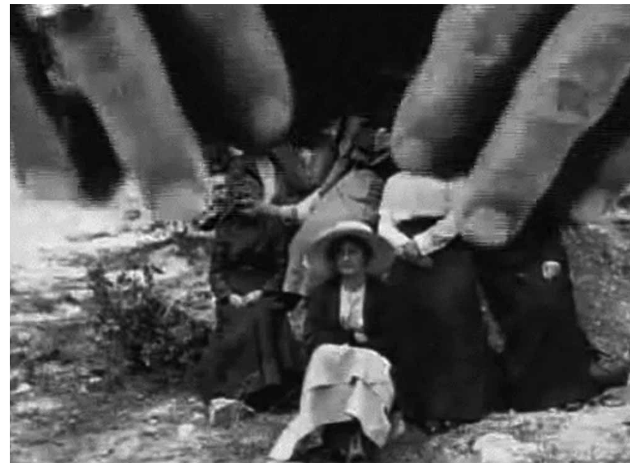
Tender Fictions (1996)

una mujer que ama a las mujeres y en concreto a una mujer, su respuesta, subrayada con un arpegio, será: «Oh, suena realmente bien». Tras relatar su primera relación sexual con una mujer, Hammer reafirma mediante una pregunta retórica su nueva identidad: «¿Era yo una lesbiana? Sí, era lesbiana».