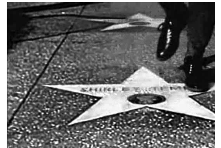
Tender Fictions (1996)