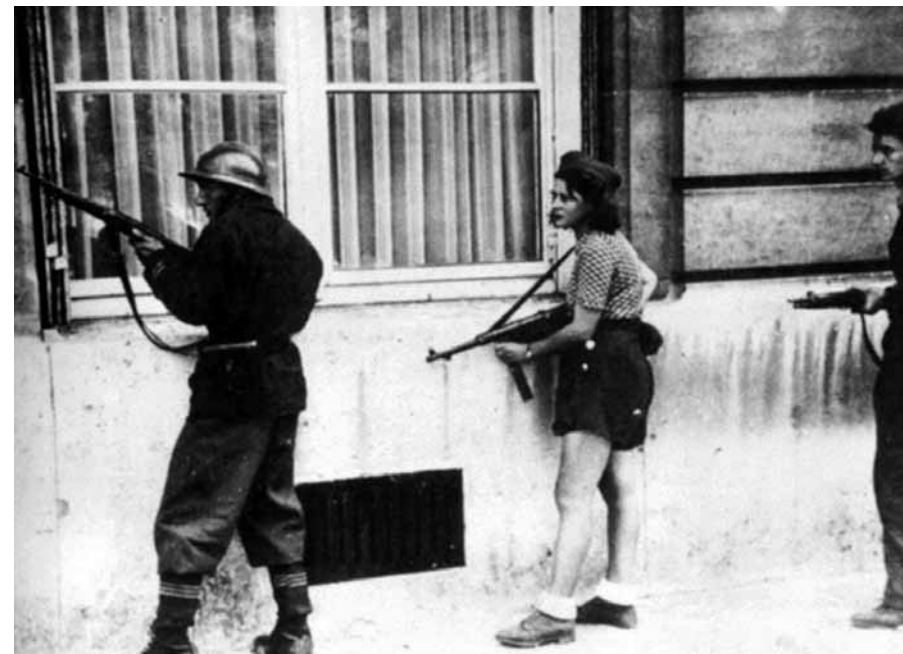
Resisting Paradise (Barbara Hammer, 2003)

que funcionan como balance de su relato/retrato y como apelativo a la audiencia. Un bombardeo de eslóganes en tercera persona del singular con los que invita a una toma de conciencia por parte del espectador o la espectadora: «EVITA LA ASIMILACIÓN», «CONVIÉRTETE EN UN YO DOBLE», «INVÉNTATE A TI MISMO», «MASCARADA», «PLANIFICA TU REPRESENTACIÓN», «ATRAVIESA CULTURAS», «MULTIPLICA LOS ROLES», «DUDA DE TUS RECUERDOS...». En definitiva, un llamamiento a la autodesignación de la identidad propia del pensamiento queer y a un travestismo en los roles de género de acuerdo a los momentos vitales y necesidades propias más allá de lo establecido por el orden simbólico patriarcal. Bajo este prisma, cabe leer también Tender Fictions como un filme autobiográfico que, gracias a sus fuertes resonancias teóricas, deconstruye la ideología del género que invita a superar la visión dual del mundo en categorías antagónicas (masculino/femenino) y, con ello, a desestabilizar la jerarquización de los mismos que ha realizado el patriarcado. Emerge un nuevo gesto micro-político en la película de Hammer que nos remite a ese yo contemporáneo que rechaza ser acotado y que aboga desde una perspectiva feminista, tal y como lo ha expresado Beatriz Preciado, por el des-reconocimiento y la des-identificación puesto que ambas serían condición y posibilidad de intervenir y transformar la realidad. 28 En la misma línea se sitúa Teresa de Laurentis, para quien este des-plazamiento es una fuente de resistencia de: