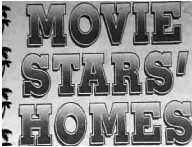
Tender Fictions (1996)