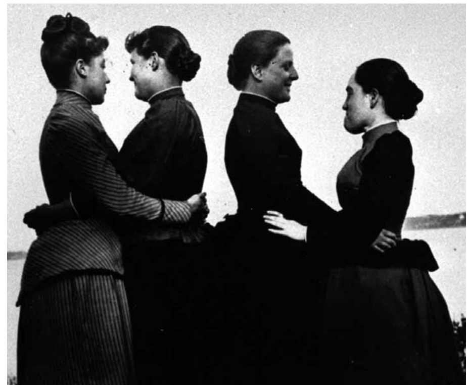
The Female Closet (1998)