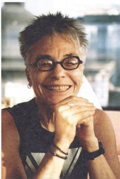
Barbara Hammer e [abaixo] fotograma da sua última película A horse is not a metaphor .

Esta "popularidade" dumha cineasta experimental pode surprender mas tem umha explicação: Umha das vertentes do seu cinema é claramente militante (ainda que a autora prefira o termo "pessoal") e reivindicativa da liberdade homosexual, adubada com explícitas imagens sexuais (coitos, masturbações, vaginas abertas, menstruações) nas que a própria cineasta participa sem pudor. Esta tendência presta-se para ilustrar exposições co-